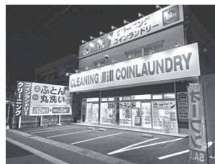
英国屋クリーニング 北条店 〔布団当日お渡しクリーニング〕 〔24時間クリーニング受付・お渡し〕が可能な店舗

地域の皆様のおかげで本年度にて50期を迎え、さらに地域の皆様に貢献し100年企業を目指してまいります。