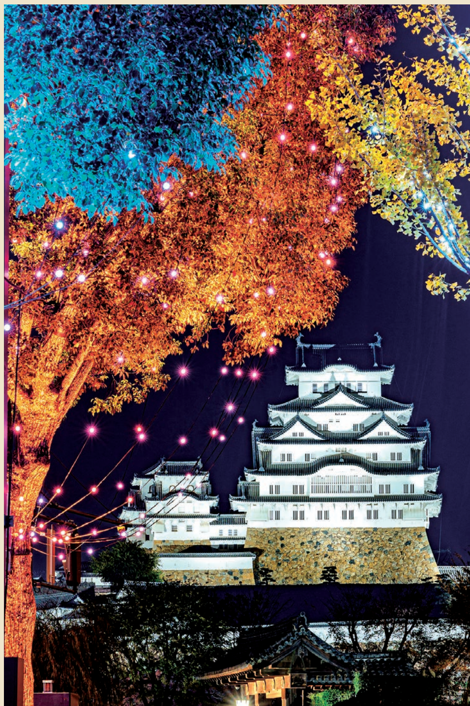
大手前通りイルミネーション